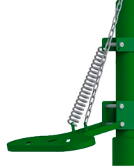
Ayak Pedal Kumandası