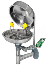
Göz Duşu Kapığı