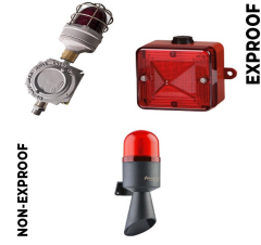
Görsel ve İşitsel Alarm