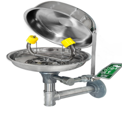
Göz Duşu Kapağı