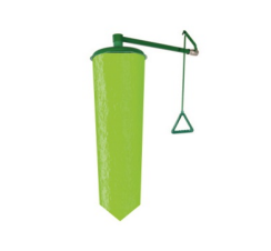
Standartlara Uygunluk Test Kiti