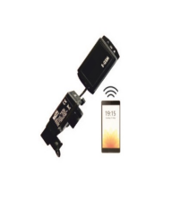
E-GSM Uyarı Cihazı