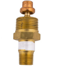
Donma Önleyici Vana