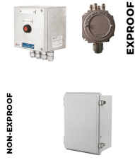
Elektrik Bağlantı Kutusu