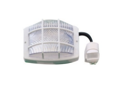
Yakınlık & Hareket Sensörü