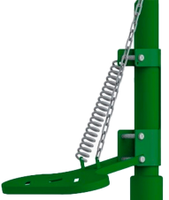
Ayak Pedal Kumandası