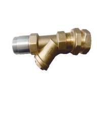
Pislik Tutucu Filtre