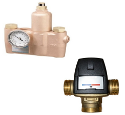
Sıcak & Soğuk Su Karıştırıcı Vana