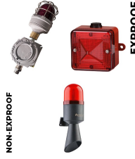
Görsel ve İşitsel Alarm