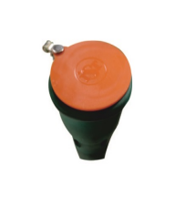
Kauçuk Toz Kapağı