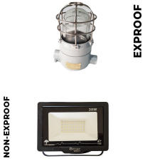
İç & Dış Kabin Aydınlatma