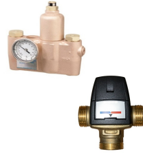
Sıcak & Soğuk Su Karıştırıcı Vana