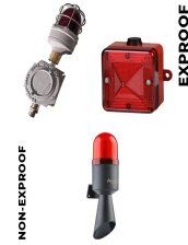
Görsel ve İşitsel Alarm