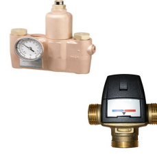
Sıcak & Soğuk Su Karıştırıcı Vana