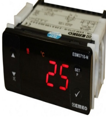
Su Sıcaklık Göstergesi