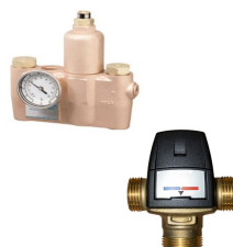
Sıcak & Soğuk Su Karıştırıcı Vana