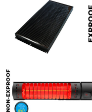
Kabin İçi Isıtıcı