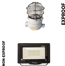
İç & Dış Kabin Aydınlatma