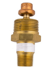
Donma Önleyici Vana