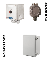
Elektrik Bağlantı Kutusu