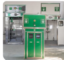
İzolasyonlu Paneller ve Yaylı Kapılar