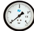
Su Basınç Göstergesi