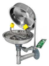
Göz Duşu Kapağı