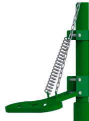
Ayak Pedal Kumandası