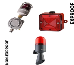
Görsel ve İşitsel Alarm