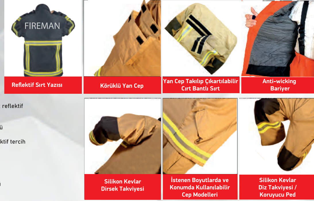
Reflektif Sırt Yazısı