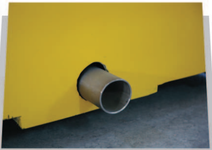
SAĐA VEYA SOLA YERLEŐTİRİLEBİLİR SU GİDERİ 3" Çıkıő