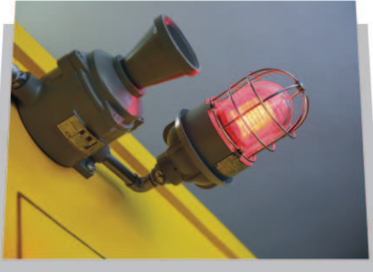
ELEKTRİKLİ ALARM - İŐIKLİ VE SESLİ (EXPROOF)

SESLİ ALARM: Ex d IIB T6 IP65 24V İŐIKLİ ALARM: Ex d IIB T4 IP65 24V