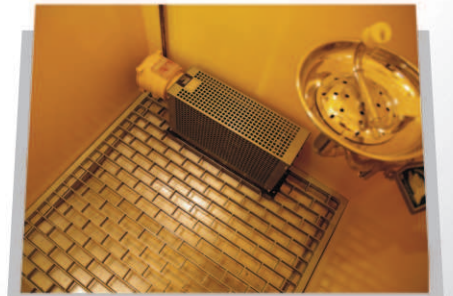
İZGARA TABAN Paslanmaz Çelik