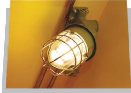
KABİN İÇİ AYDINLATMA (EXPROOF)

SESLİ ALARM: Ex d IIB T6 IP65 24V İŐIKLİ ALARM: Ex d IIB T4 IP65 24V