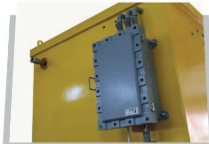
ELEKTRİK PANOSU (EXPROOF)