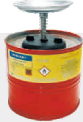
SAFECAN® 4 lt SOLVENT BANMA KABI P/N : 22050004