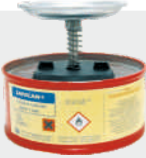
SAFECAN® 2 lt SOLVENT BANMA KABI P/N : 22050002