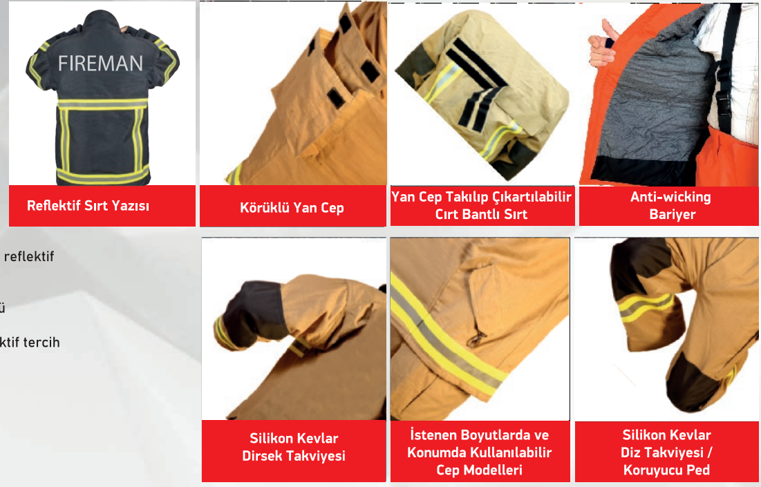
Reflektif Sırt Yazısı